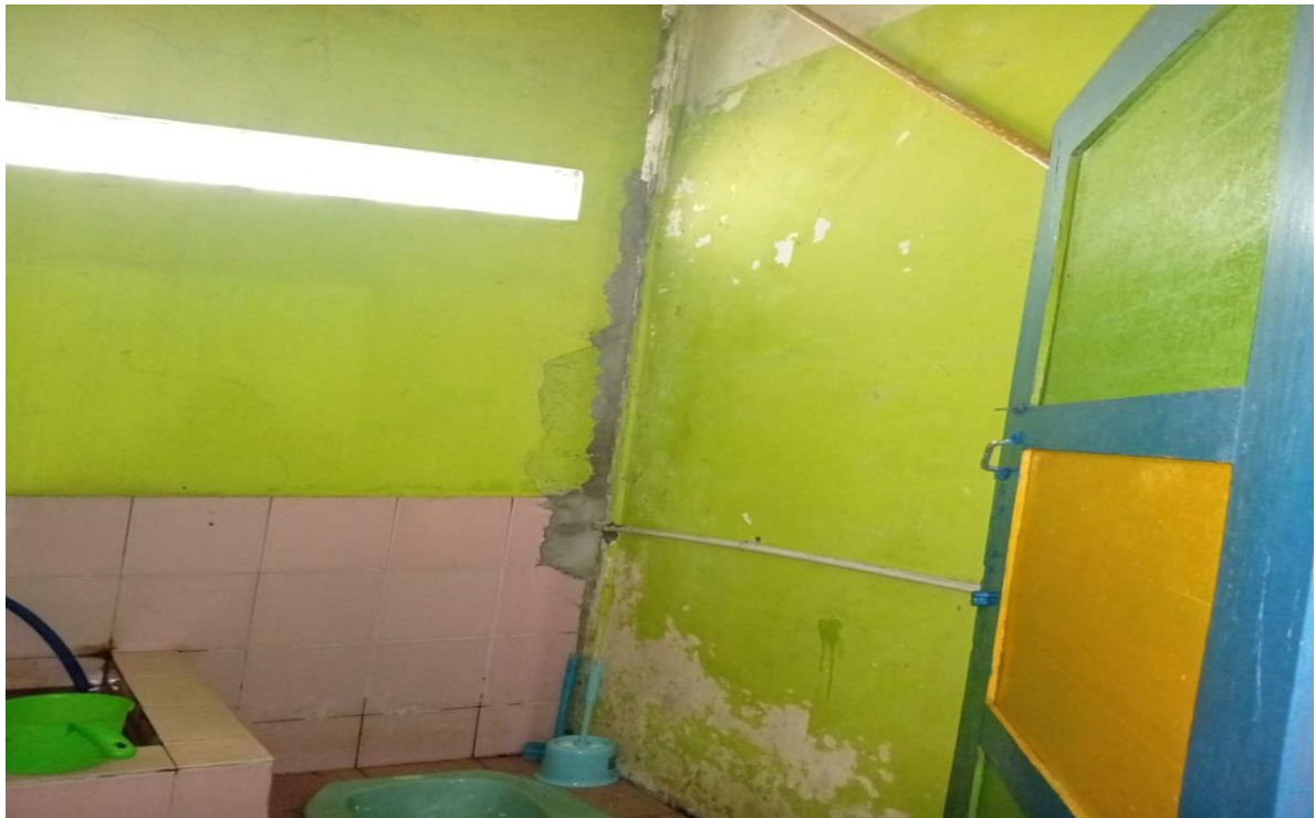
Keadaan Atap kamar kecil / toilet yang bocor rapuh