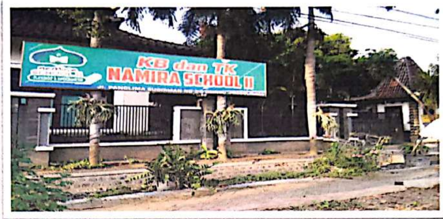
Foto TK Namira School II tampak Depan