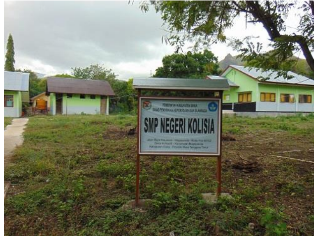
PAPAN NAMA SEKOLAH