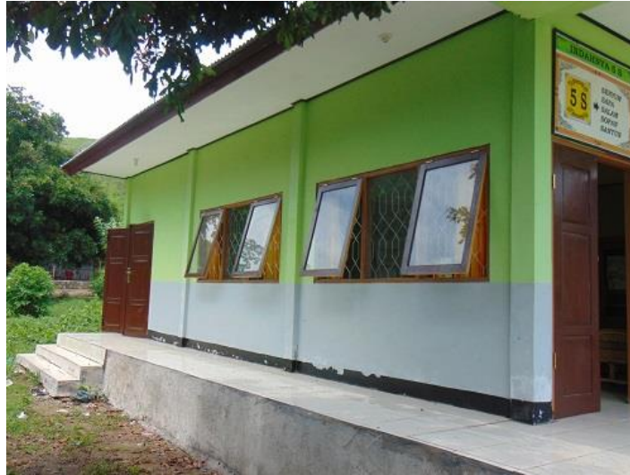
BANGUNAN UNTUK RUANG GURU DAN KEPALA SEKOLAH TAMPAK SAMPIING