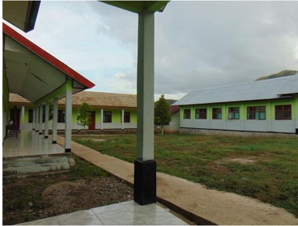
BANGUNAN LAB IPA DAN BANGUNAN KELAS 9 DAN LAB KOMPUTER