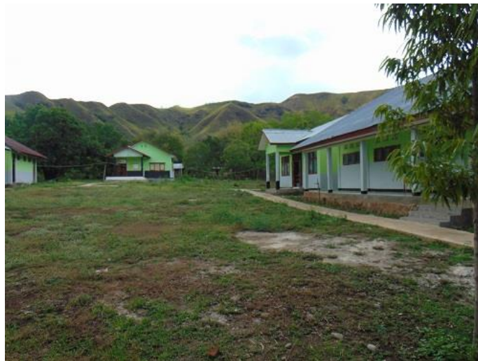
LAPANGAN OLAH RAGA DAN UPACARA