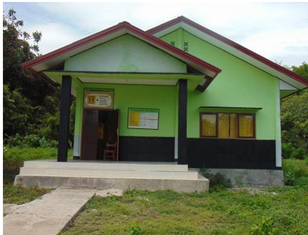
BANGUNAN UNTUK RUANG GURU DAN KEPALA SEKOLAH