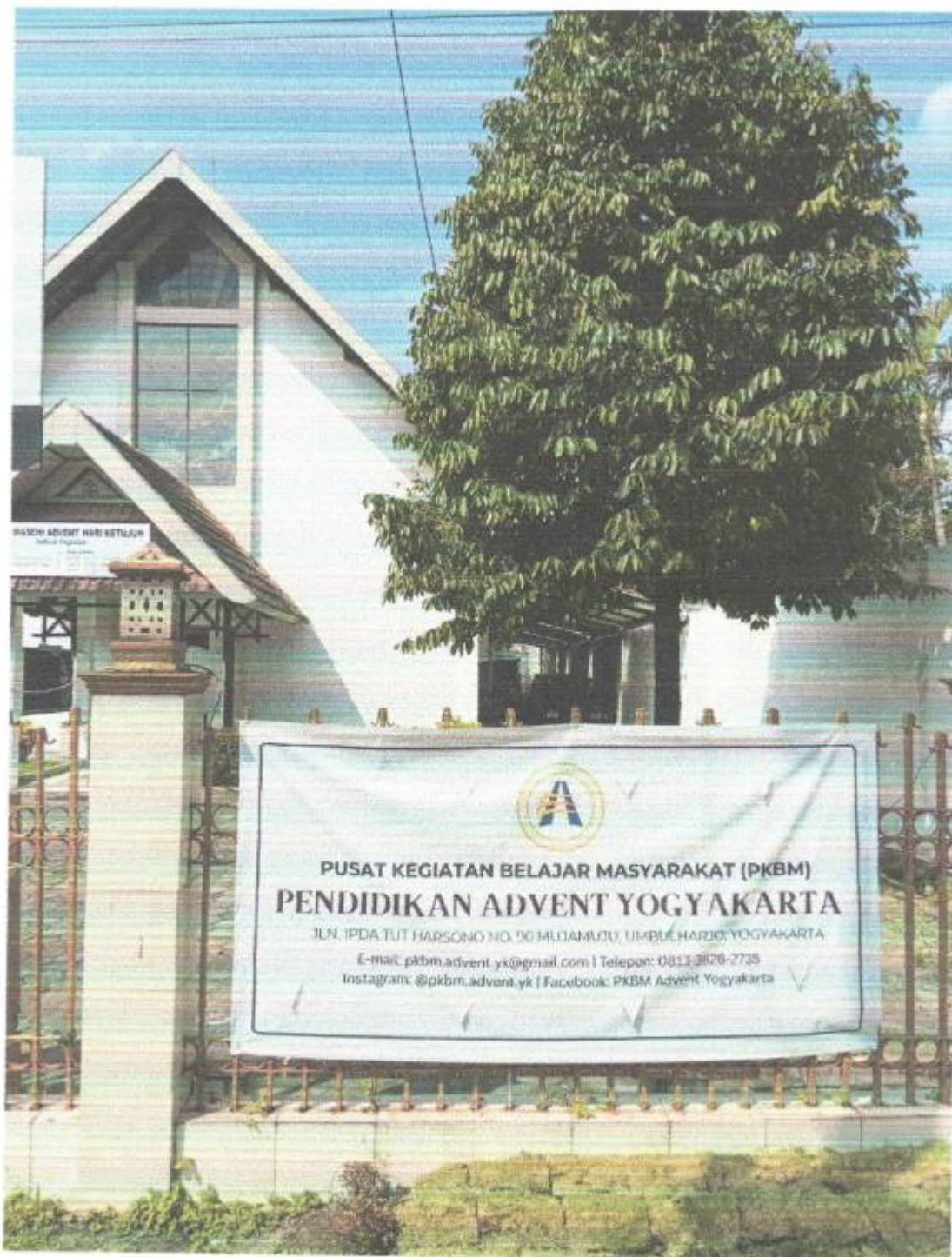
Foto plang nama PKBM Pendidikan Advent Yogyakarta yang dipasang di pagar depan halaman sekolah.