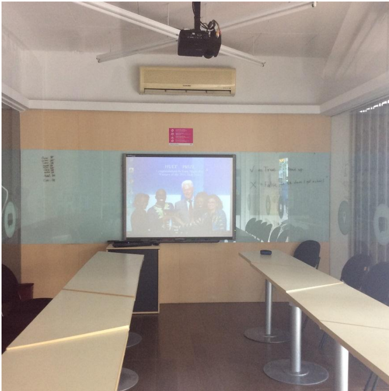
Gambar Ruang Kelas Cambridge