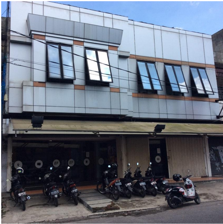
Gambar Gedung Depan EF Jember