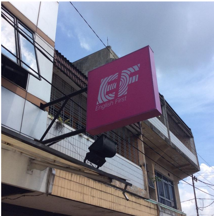
Gambar Neon Box EF Jember