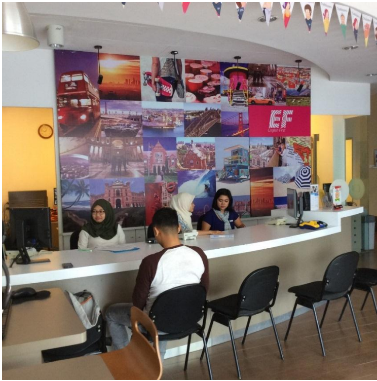
Gambar Lobby Bawah EF Jember