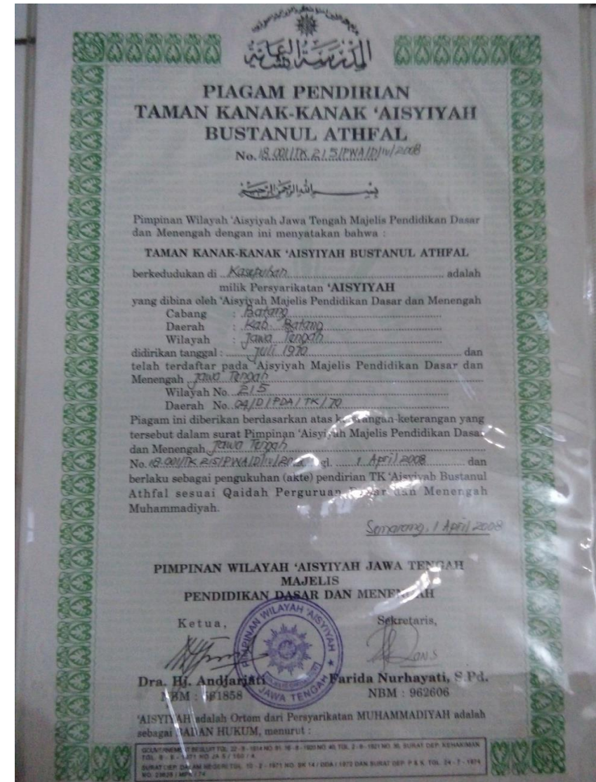
SK Pendirian TKS ABA Kasepuhan