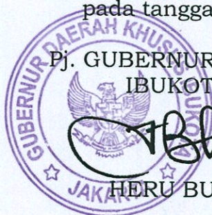
HERU BUDI HARTONO

Pj. GUBERNUR DAERAH KHUSUS IBUKOTA JAKARTA,