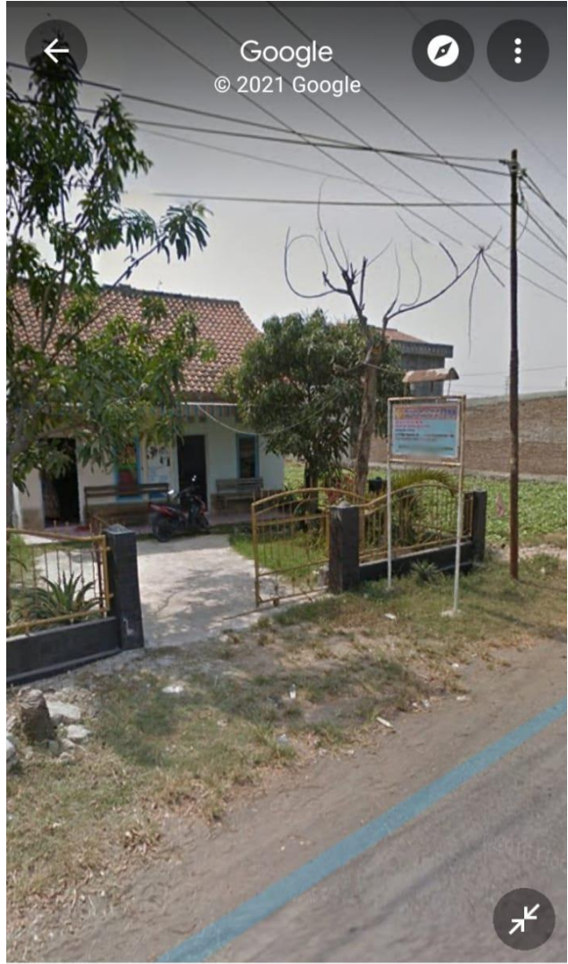
LPK Putri Amazonn