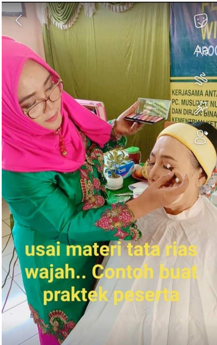
usai materi tata rias wajah.. Contoh buat praktek peserta